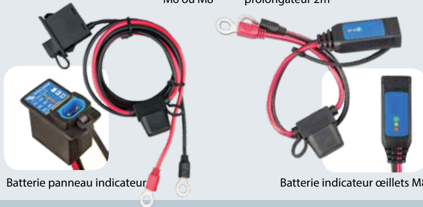
Batterie panneau indicateur